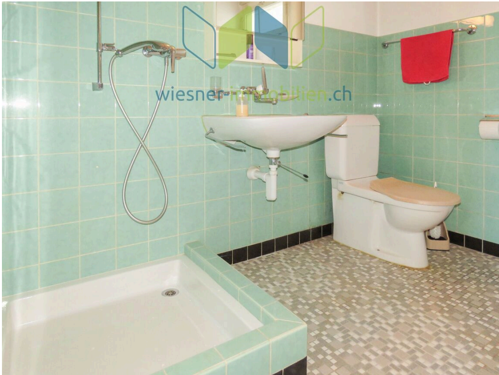
Waschraum / Dusche / WC