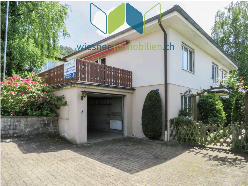
Eingangsbereich und Garage