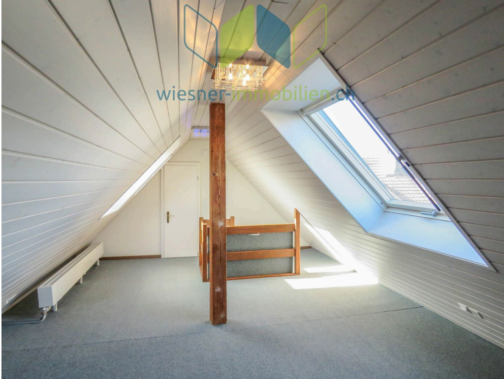
Estrich Zimmer 4